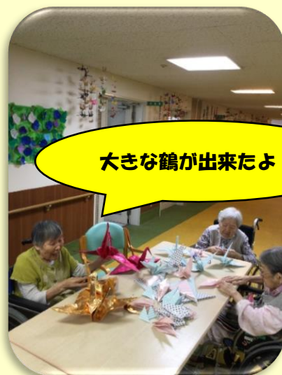
大きな鶴が出来たよ！