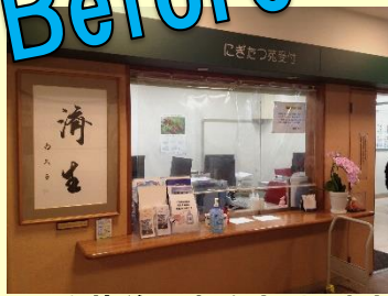
改装前の事務室・相談室